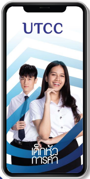
01 Download Application "UTCC Plus" สามารถดาวน์โหลดได้ทั้ง 2 ระบบ Android และ IOS