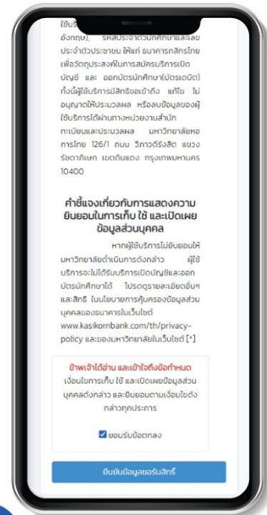
03 อ่านรายละเอียดให้ชัดเจน หากมีข้อสงสัยให้สอบถามผู้ให้บริการ ก่อนกดยอมรับข้อตกลง