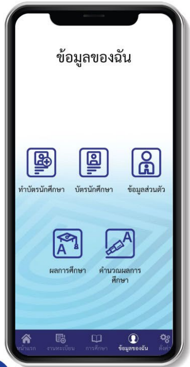
02 กดไปที่หน้าข้อมูลของฉัน เลือกเมนู "ทำบัตรนักศึกษา" กรอกรหัสนักศึกษาและเลขประจำตัวประชาชนแล้วกด Submit